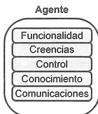
Figura 2. Arquitectura de un Agente.

todos los críticos para la validación de la hipótesis, cuando el mediador interviene para resolver conflictos entre el autor y algún o algunos críticos, etc. Una especificación más completa de este modelo con sistemas multi-agente se encuentra en [6].